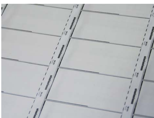
△ 面付けした基板でのご提供

長年にわたる薄膜加工技術の経験と実績で生み出された高性能静電容量方式タッチパネルを、お客様の納入形態に合わせてご提供いたします。