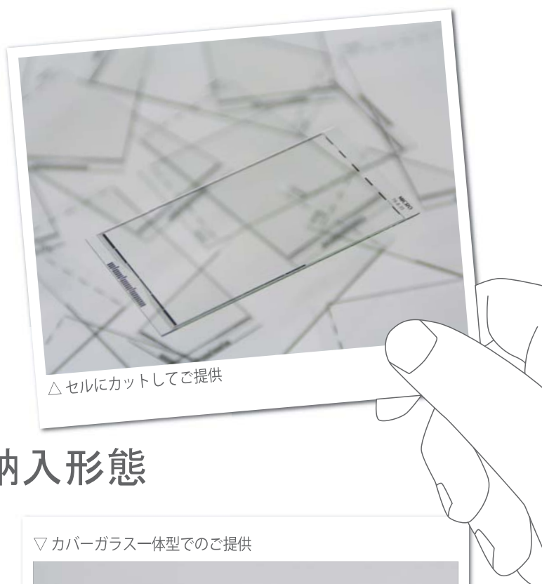
△ セルにカットしてご提供